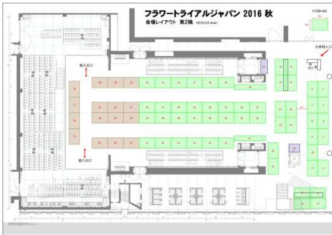
会場レイアウトイメージ（一部）